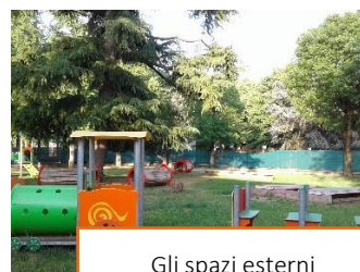
Gli spazi esterni