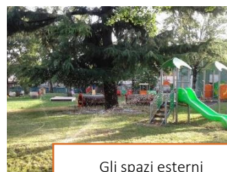
Gli spazi esterni