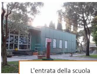
L'entrata della scuola