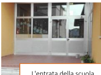
L'entrata della scuola

A partire dall'anno scolastico 2009/2010, la scuola, pur mantenendo l'ispirazione cattolica, ha affidato l'insegnamento a personale laico. Da gennaio 2016 la scuola è gestita dalla cooperativa sociale Cultura e Valori. Dall'anno scolastico 2017/2018 la Scuola offre il servizio anche ai bambini dai 24 ai 36 mesi, con l'apertura della Sezione Primavera.