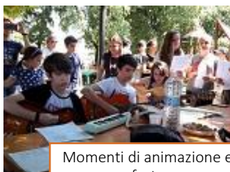
Momenti di animazione e festa