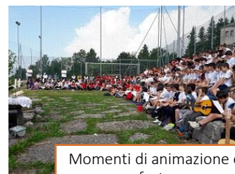
Momenti di animazione e festa