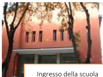
Ingresso della scuola

La scuola è nata dopo la chiusura del collegio dei Padri Carmelitani Scalzi, che sorgeva accanto al santuario di Santa Teresa di Tombetta (Verona), attorno ad un movimento di simpatia e di richiesta per aprire una scuola cattolica, precisamente una scuola media. Il primo anno scolastico è stato quello 1979/80 con 25 iscritti. Si apriva, dopo alcuni anni, una seconda sezione con classi fino a trenta alunni. È del 2000 l'ingresso nel contesto della Cultura e Valori. Nel settembre 2014, finito il rapporto con i Padri Carmelitani, la sede della scuola è stata trasferita nel quartiere Golosine presso l'Istituto Virgo Carmeli, passato a sua volta sotto la gestione della Cooperativa Cultura e Valori.