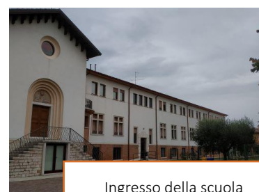
Ingresso della scuola

responsabile. Questa grande intuizione portava alla stesura, fin dalla nascita delle Scuole Cattoliche Diocesane (1978), di un "Progetto Educativo" che, come vedremo più avanti, sarà ripreso ed evoluto come elemento portante dall'attuale gestore. Nel 1996, causa diversi e complessi motivi soprattutto di ordine economico, il Vescovo di Verona rinunciava alla titolarità e gestione delle varie Scuole Diocesane che, nel frattempo, maturavano l'idea di un'autogestione. Un gruppo di insegnanti, infatti, con alcuni genitori particolarmente sensibili, dà vita ad una cooperativa denominata CULTURA E VALORI, che permetterà alla scuola DON P. ALLEGRI di continuare la sua funzione didattico-educativa al servizio della comunità e del territorio mantenendo la fondamentale caratteristica cattolica della scuola già ribadita nel Piano Educativo d'Istituto (P.E.I.). La scuola Media Don P. Allegri dal 2012/2013 si è trasferita nella nuova sede a Villafranca di Verona, in Via Aldo Rizzini, 4 presso il convento dei Padri Cappuccini