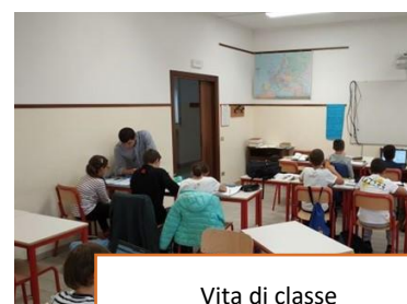
Vita di classe